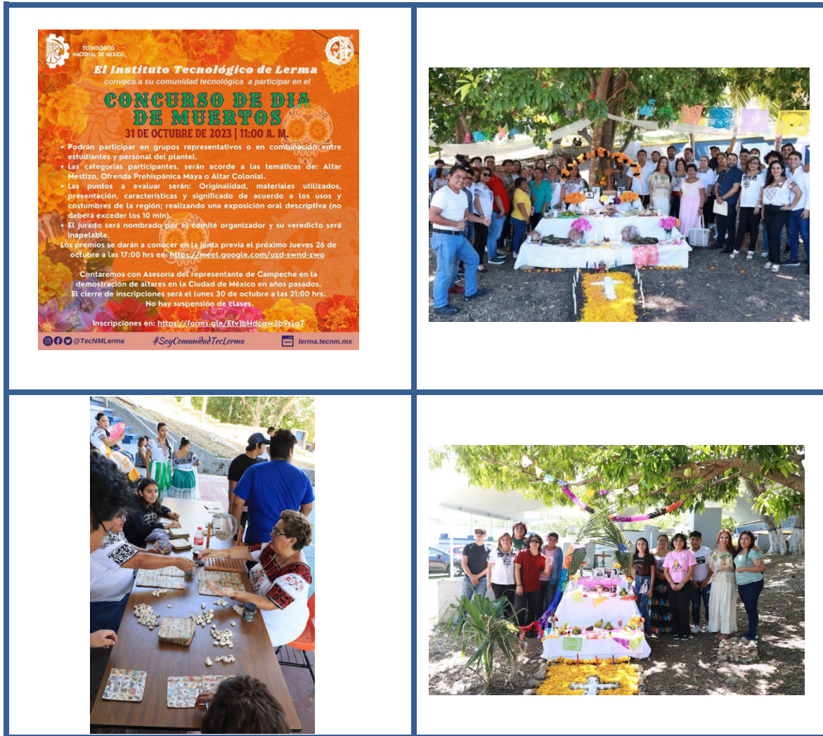
Imagen 11. Concurso de Altares 2023.

y 2 hombres un total de 8 personas. Como parte de las tradiciones del estado de Campeche se realizó la tradicional lotería campechana, con participación del estudiantado, personal docente y administrativo.