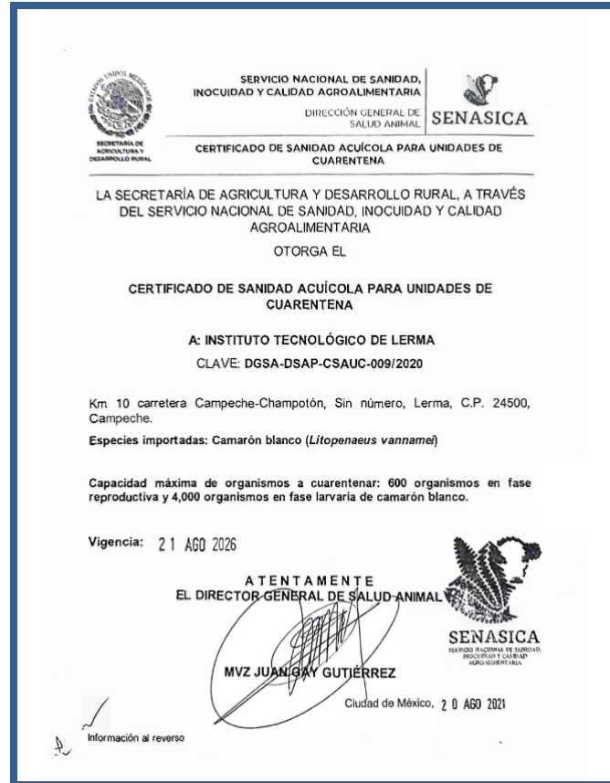
Imagen 18. Certificado de Sanidad Acuícola

OBJETIVO 5. Fortalecer la vinculación con los sectores público, social y privado, así como la cultura del emprendimiento, a fin de apoyar el desarrollo de las regiones del país y acercar a los estudiantes y egresados al mercado laboral.