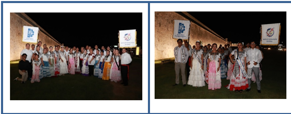
Imagen 10. Participación del ITLerma en el I Encuentro Folklórico de Identidad y Tradición 2023.

Con motivo de las festividades alusivas al mes de la Campechanidad, el contingente del Instituto Tecnológico de Lerma conformado por más de 65 integrantes: 45 mujeres y 20 hombres de la comunidad tecnológica entre estudiantes, personal de apoyo y asistencia a la educación, docente y directivo; quienes con característica algarabía participaron en el derrotero Encuentro Folklórico de Identidad y Tradición 2023, organizado por la Secretaria de Cultura y Secretaria de Educación (SEDUC) del Estado el Estado de Campeche.