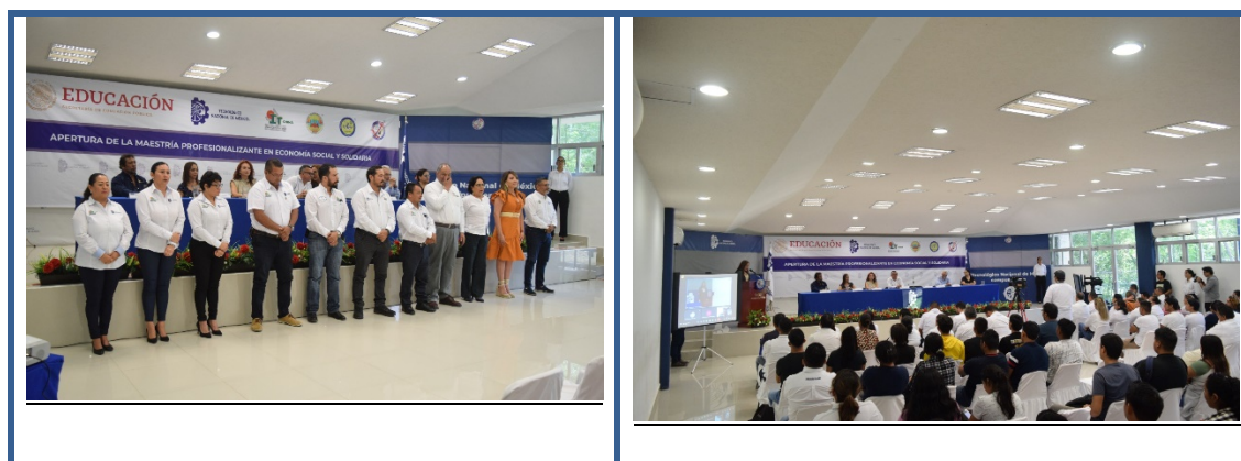
Imagen 23. Maestría en economía social y solidaria

Se llevó a cabo la Presentación de la Maestría Profesionalizante en Economía Social y Solidaria en Económica Social y Solidaria. Este evento fue organizado en colaboración entre los Institutos Tecnológicos de Chiná, Campeche, Conkal y Lerma, junto con la Secretaría de Educación del Estado de Campeche y el Tecnológico Nacional de México.