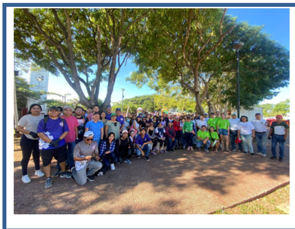
Imagen 17. Jornada de limpieza en la zona de manglar del #ParqueCampeche

El objetivo es generar consciencia en las nuevas generaciones, de que una ciudad limpia no es la que se recoge la basura más veces, sino la que no tira la basura a la calle y mucho menos a nuestros mares o manglares.