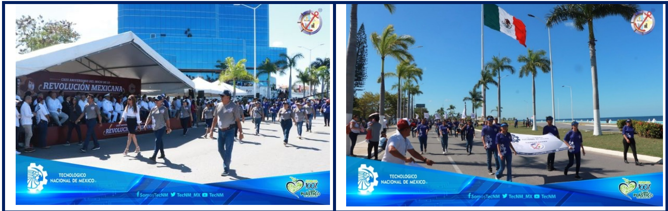
Imagen 12. "Desfile Cívico-Deportivo de la Conmemoración al 113 Aniversario del Inicio de la Revolución Mexicana".