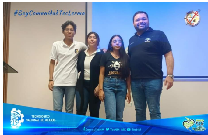
Imagen 5. Concurso estatal de Spelling Bee 2023

Se destaca la participación que refleja el compromiso y el esfuerzo continuo de nuestra comunidad educativa en el desarrollo de habilidades lingüísticas y competencias comunicativas participando en el concurso estatal de Spelling Bee 2023, organizado por el Instituto Tecnológico de Estudios Superiores de Champotón, obteniendo el tercer y quinto lugar.