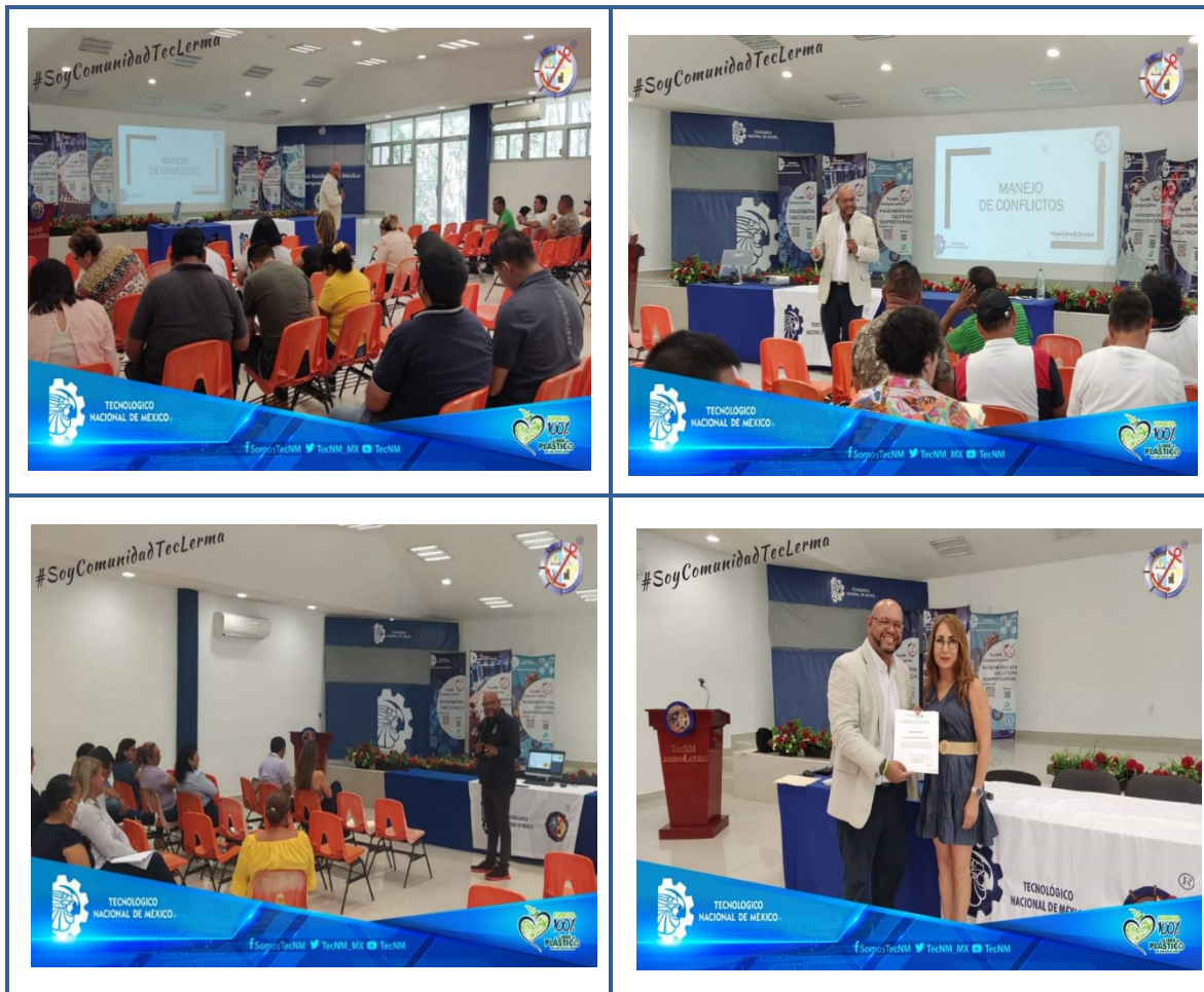
Imagen 1.- Curso manejo de conflictos

Con fundamento en el Programa Anual de Capacitación (PAC), 2023 en junio, 2023 se realizó el curso “ Manejo de Conflictos ” dirigido a personal directivo, de Apoyo y Asistencia a la Educación y docente. Impartido por la Consultoría Hawkins & Drake en beneficio de 45 personas: 28 directivas(os); 17 de Apoyo y Asistencia a la Educación: 20 mujeres y 25 hombres.