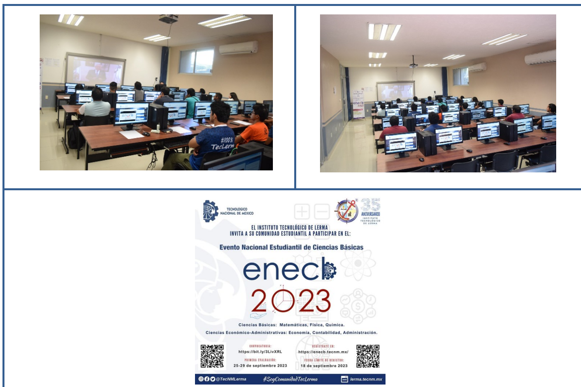
Imagen 4. Evento Nacional Estudiantil de Ciencias Básicas “ENECB 2023”

El Tecnológico Nacional de México se compromete a fortalecer la formación integral de la comunidad estudiantil de educación superior tecnológica, con el objetivo de desarrollar plenamente todas las potencialidades y capacidades científicas de las personas. Destacamos la participación de estudiantes de nuestros diversos programas educativos en el Evento Nacional Estudiantil de Ciencias Básicas “ENECB 2023” en equipos multidisciplinarios. En el año que se reporta participo un equipo de estudiantes conformado por los programas educativos de ingeniería mecánica, mecatrónica y administración, integrado por 5 estudiantes: 3 hombres y 2 mujeres.