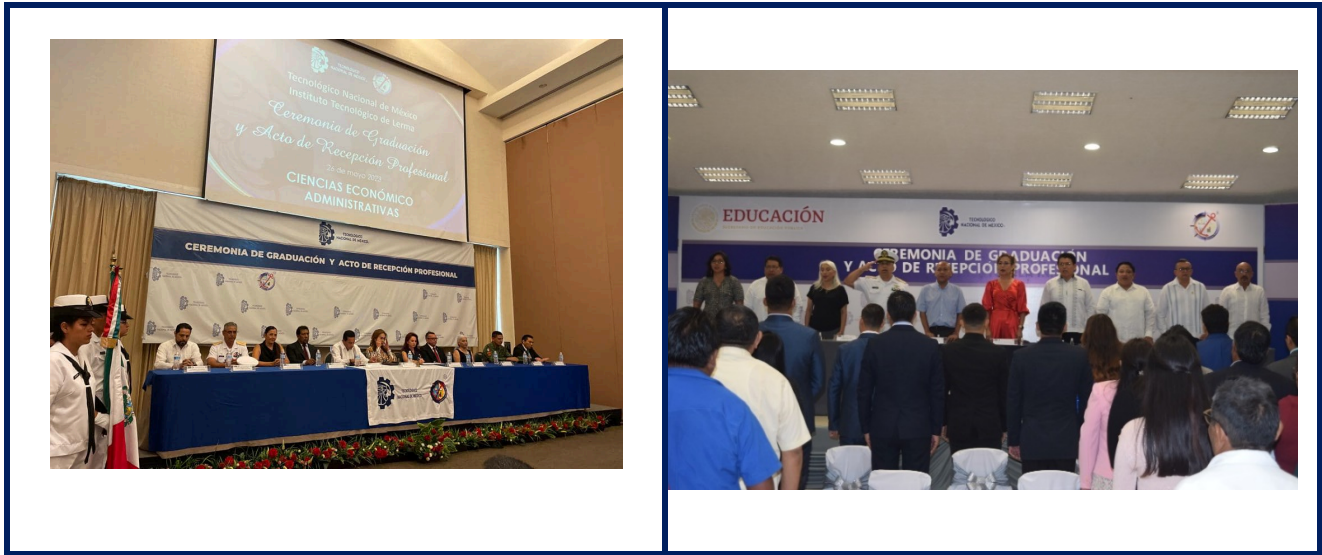
Imagen 8. Ceremonia de Graduación y Acto de Recepción Profesional