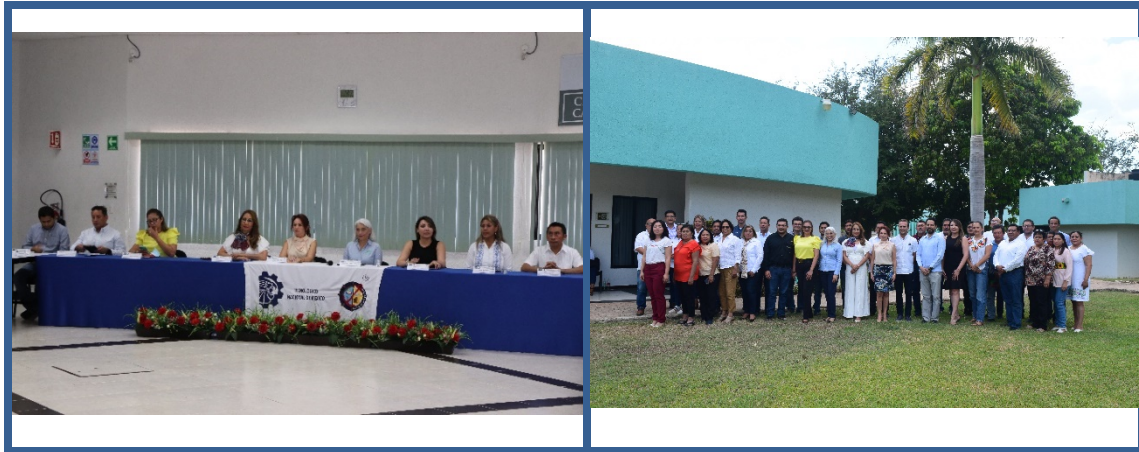
Imagen 19. Consejo de Vinculación