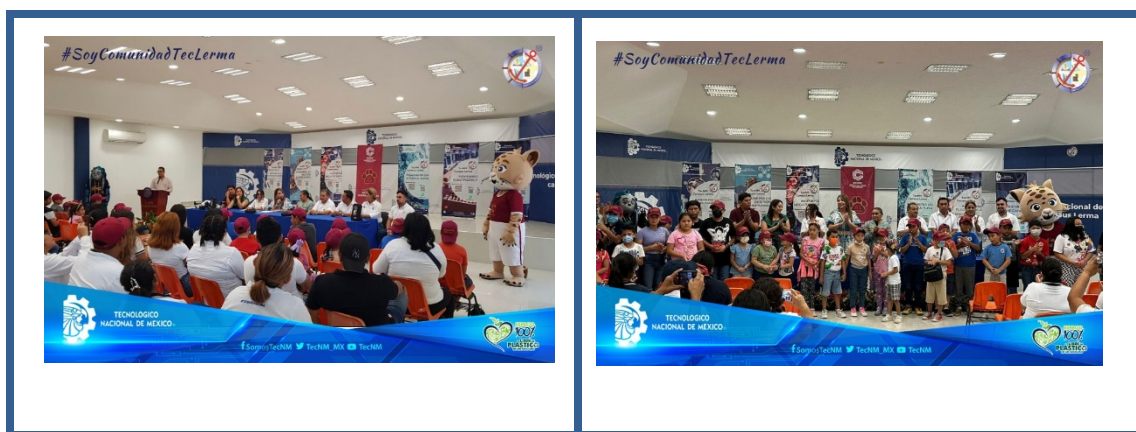
Imagen 21. Programa de Aptitudes Sobresalientes

En colaboración con la Secretaría de Educación del estado, se brindó atención a niñas y niños provenientes de diversas instituciones educativas de educación básica. A través del Programa de Aptitudes Sobresalientes, se trabajó para potenciar el desarrollo de la niñez campechana, promoviendo saberes vinculados con la responsabilidad social, equidad de género, inclusión, excelencia académica, vanguardia, innovación social e interculturalidad.