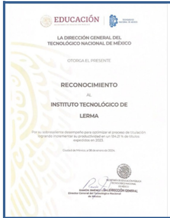
Imagen 9. Reconocimiento de eficiencia en los procesos académicos

ET.2 Establecer mecanismos que fomenten la igualdad, la no discriminación y la inclusión en el TecNM