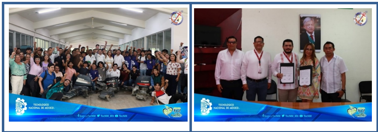
Imagen 20. Convenios de vinculación

Referente a convenios de vinculación estos se alinearon con la visión y estrategias del Instituto Tecnológico de Lerma, destacando el aumento de la matrícula, la certificación para ofrecer educación de calidad, la implementación del Modelo de Educación Dual y la presentación de la estrategia NODESS, centrada en la creación de alianzas para el desarrollo de ecosistemas de economía social y solidaria. Esta estrategia, actualmente coordinada por el Instituto Nacional de la Economía Social (INAES), busca involucrar a la sociedad a través de los más de 254 campus del Tecnológico Nacional de México para fortalecer los procesos de integración productiva, consumo, distribución, ahorro y préstamo para satisfacer las necesidades regionales. Además, se hizo especial hincapié en el fortalecimiento de las relaciones con el sector privado, como en el caso de la empresa Coca Cola y su fundación, con la que se llevarán a cabo proyectos conjuntos. Se instó a los participantes del consejo a continuar colaborando y sumando esfuerzos de manera solidaria para alcanzar los objetivos planteados.