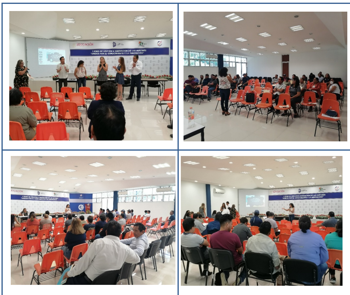
Imagen 3. Curso “Prácticas Docentes con Perspectiva de Género y de inclusión”

1.4 Mejorar el posicionamiento del Tecnológico Nacional de México a nivel nacional e internacional.