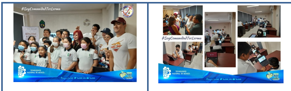
Imagen 22. Club de Líderes en Robótica