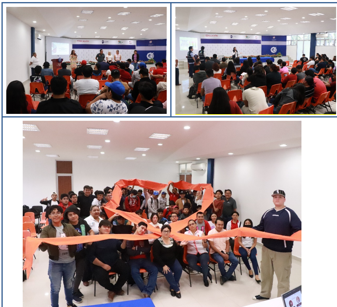
Imagen 2. “Hombres contra la violencia hacia las mujeres, las niñas y los niños. Masculinidades Alternativas”

En octubre, 2023, se impartió el curso “Hombres contra la violencia hacia las mujeres, las niñas y los niños. Masculinidades Alternativas” ofertado por la Secretaría de Bienestar de México/Coordinación Sectorial de Igualdad de Género/Programas Transversales; en noviembre, se realizó el evento conmemorativo del Día Internacional de la Eliminación de la Violencia donde participaron personal directivo(a), docentes, estudiantes y personal de Apoyo y Asistencia a la Educación.