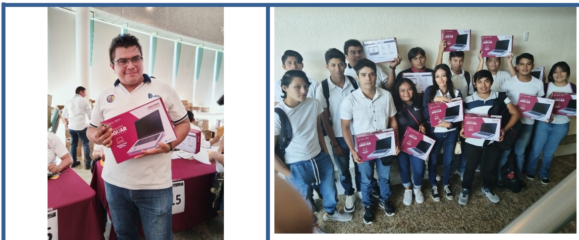
Imagen 7 Becas Programa Bienestar Digital