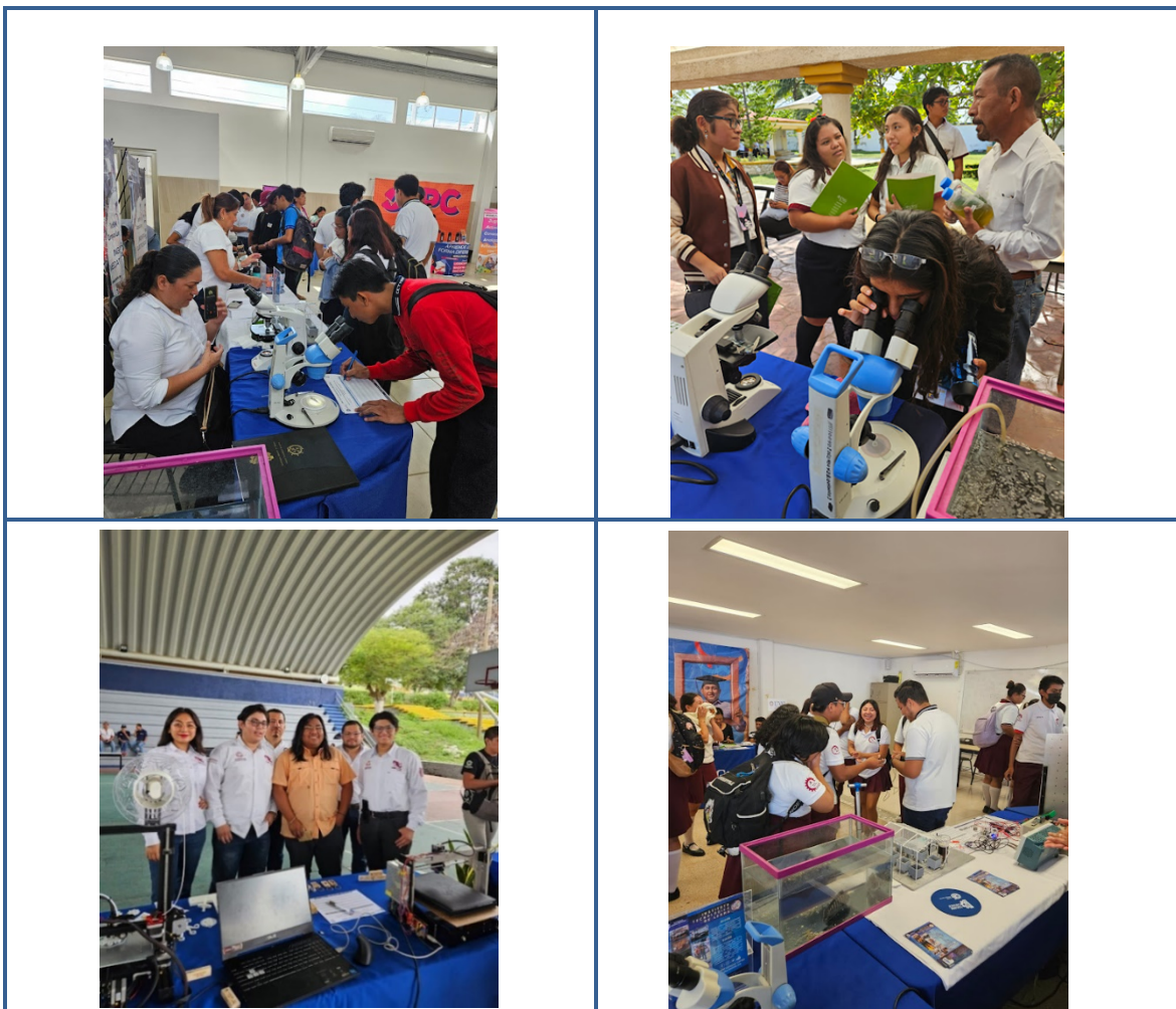
Imagen 6. Promoción de la Oferta Educativa