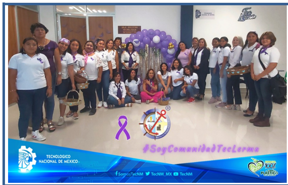
Imagen 14. Mujeres constructoras de paz

se ofrecieron dos conferencias de relevancia. La primera, titulada "El Orgullo de Ser Mujer". La segunda versó sobre "Derechos Humanos de las Mujeres", a cargo del Instituto de la Mujer del Estado de Campeche. Estas actividades no solo sirvieron como tributo a la lucha por los derechos de las mujeres, sino que también ofrecieron un espacio para la reflexión y el empoderamiento femenino en la sociedad contemporánea.