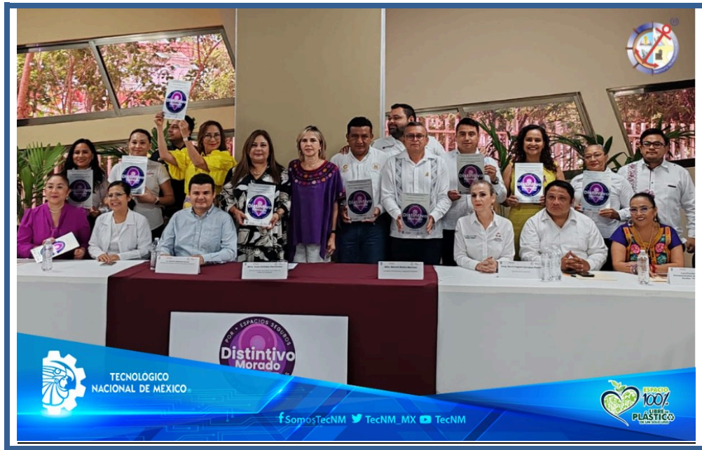
Imagen 15. Distintivo Morado