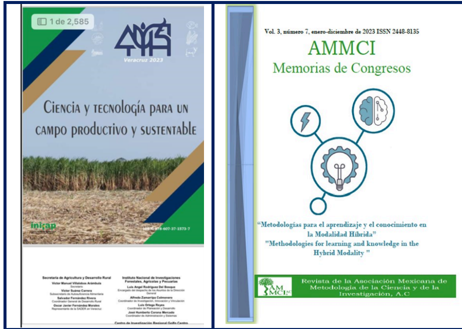
Imagen 16. Revistas